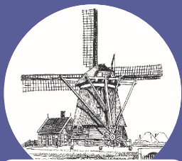
Zes- of achtkante buitenkruier