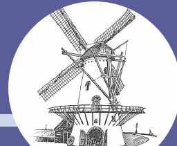
Ronde stenen stellingmolen