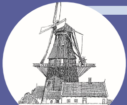
Zes- of achtkante stellingmolen