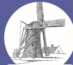
Ronde stenen grondzeiler