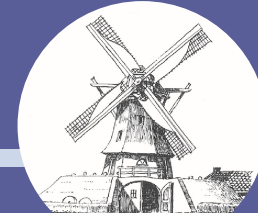
Zes- of achtkante beltmolen